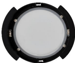
Ansicht 1 (ohne Dekor)